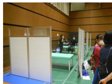
ケアスポットコーナー