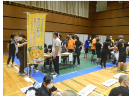
サブコートにて選手集合、各キャプテンと審判立ち合いの元サーブ・コートを決定 審判団先頭に整列し会場入場 【坊ちゃん・マドナンナの部 各予選と決勝リーグ】