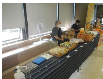
特産品販売・ねんりんPRグッズ