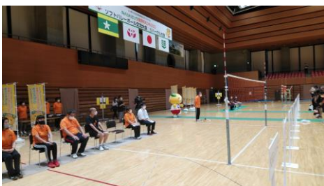
開式宣言 富野副会長