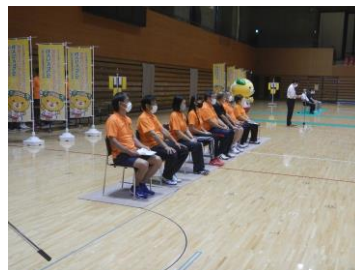
大会会長あいさつ