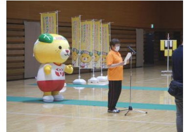
森会長 歓迎のことば