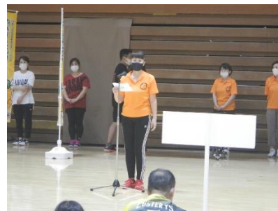
大会会長あいさつ 野志会長 閉式宣言 三瀬副会長