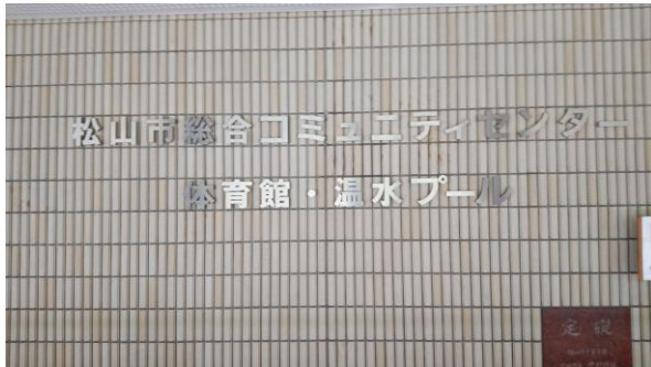
松山市総合コミュニティセンター

会場 松山市総合コミュニティセンター 期日 令和4年8月21日(日) 主催 ねんりんピック笑顔のえひめ2023松山市実行委員会 主幹 愛媛県ソフトバレーボール連盟 参加チーム 香川県7チーム 高知県1チーム 愛媛県6チーム 合計14チーム