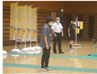
準備体操(まつイチ体操)松山市健康づくり推進課