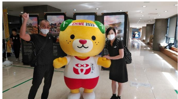
愛媛県PRキャラクター みぎゃん